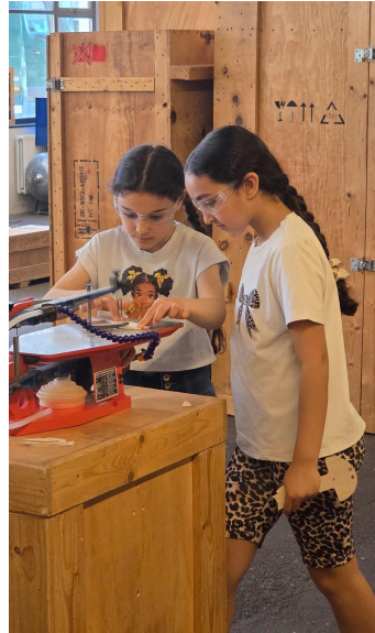
Groep 4 De Ontdekkfabriek