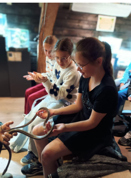
Groep 6 De Oliemeulen