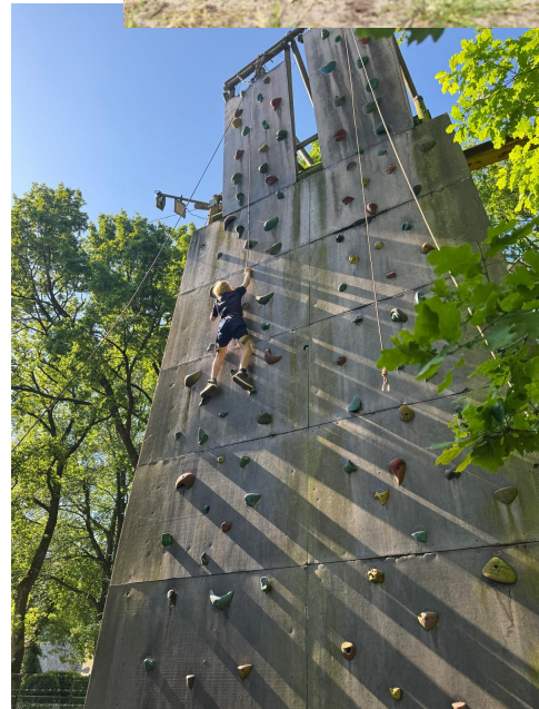
Groep 7 De Hooghei