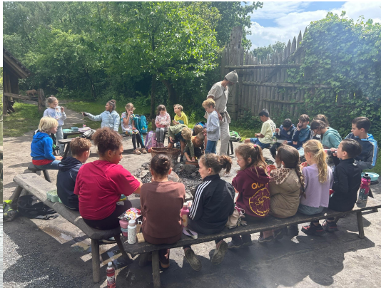
Groep 5 Prehistorisch dorp